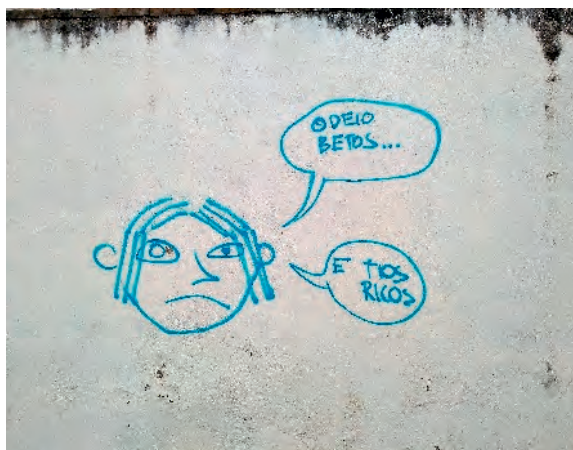
Fig. 1: Odeio betos e tios ricos / "Odio i fighetti e i tipi ricchi" - Campolide - Lisbona

Adottata negli ultimi anni, a partire dalla crisi economica del 2008, la legislazione fiscale portoghese ambisce - e i dati confermano che di fatto riesce - a stimolare la ripresa economica attraendo capitali ma soprattutto persone che risiedono abitualmente in altri paesi. L'obiettivo è di richiamare popolazione che permetta all'economia del paese di mettersi in moto di nuovo dopo la crisi. Il fine è l'aumento di densità di popolazione in un paese che vive un calo demografico profondo, una densità che è in grado di innescare in tempi rapidi la crescita.