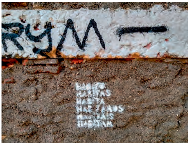
Figura 10: Habito habitas habita habitamos habitais habitan / "Abito abiti abita abitiamo abitate abitano" - Campolide - Lisbona