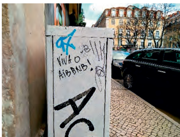
Fig. 5: Viva o Airbnb! / “Viva Airbnb!” – Misericordia – Lisbona

Lisbona entra a partire dal 2014-15 nel “sistema globale urbano in due circuiti specifici e interdipendenti: quello dell'investimento immobiliare e quello del turismo urbano” (Marques Pereira, 2018, p. 152, traduzione dell'autrice). Il potenziale economico-finanziario dei centri urbani, sostenuto dall'investimento privato (essenzialmente immobiliare) viene utilizzato come soluzione alla crisi basandosi, nel caso di Lisbona, sul “triangolo virtuoso: rigenerazione urbana – turismo (di massa) – investimento immobiliare globalizzato” che fa prospettare un accentuarsi in futuro della specializzazione funzionale della città, nel contesto urbano globale, come “città-ozio-investimento” (Marques Pereira, 2018, p. 153 e 154, traduzione dell'autrice).