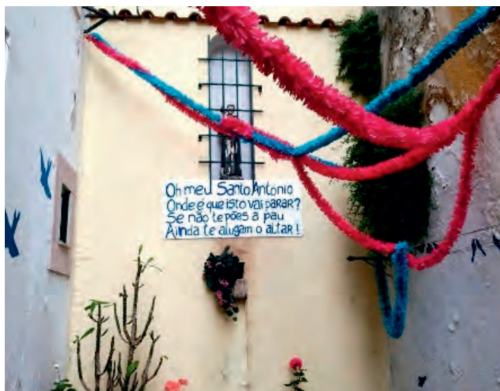
Figura 9: Oh meu Santo António Onde é que isto vai parar? Se não te pões a pau Ainda te alugam o altar! / "Mio Santo Antonio Dove andremo a finire? Se non metti il bastone Ti affitteranno anche l'altare" - Misericordia - Lisbona, Foto di: A. Allegri

L'articolo ha esposto sinteticamente le peculiarità del caso portoghese, esempio di un paese che ha costruito la propria ripresa economica dopo la grave crisi del 2008 e gli aiuti ricevuti dalla UE e dal FMI in cambio di una correzione dei conti pubblici (oggi notevolmente ridotti nel caso di Lisbona) e di riforme strutturali, anche attraendo stranieri come nuovi residenti. L'immagine del Portogallo, con Lisbona in testa, a partire dal 2014 cambia profondamente nel panorama globale; Lisbona passa da capitale periferica e decadente a città globale attraente.