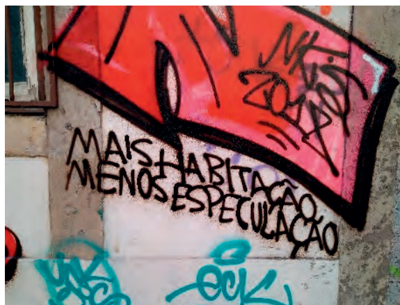
Fig. 2: Mais habitação Menos especulação / Più residenza meno speculazione – Santo António – Lisbona

Quanto brevemente esposto sopra pone in evidenza come attrarre capitali e persone e stimolare la densità di popolazione attivando agevolazioni fiscali siano state azioni alla base della costruzione della ripresa economica del Portogallo. 6 I fattori che hanno portato alla crescita e ciò che sta alla base della rinascita del paese si stanno confrontando ora, nelle maggiori città portoghesi, con il fenomeno del turismo crescente innescando dinamiche ben note a molte capitali europee.