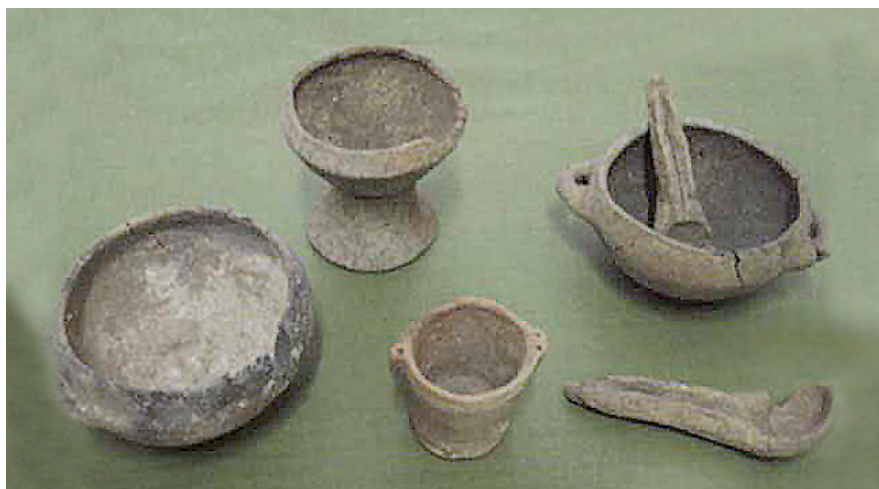
Vasellame da mensa rinvenuto in una tomba nella necropoli preistorica dell’Uditore Palermo, Museo archeologico Salinas Palermo.

In agosto la famiglia si trasferiva a li ficu per raccogliere il frutto maturo che essiccato al sole, variamente confezionato, veniva venduto.