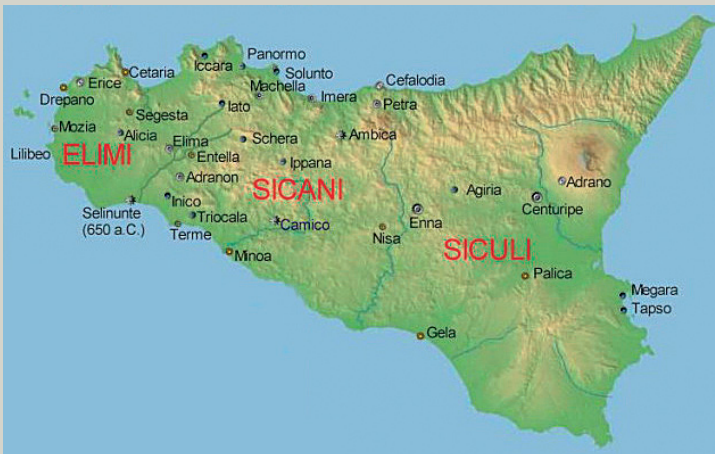
Composizione etnica della Sicilia prima dell'arrivo dei Greci e dei Fenici.

Mappa rielaborata tratta da Paolo Betta e Fausto Cantarella: Dal mito alla storia. Il pecorino siciliano . Ed. Correr, Palermo 2000. Sarebbe che nel neolitico nuclei di pastori e agricoltori con pecore, capre e semi provenienti dal Medio Oriente colonizzassero la Sicilia, questi rappresenterebbero il primo nucleo dei sicani. I siculi e gli elimi sarebbero giunti intorno al XV sec. La Sicilia secondo Tucidide ed Erodoto era abitata dai mitici lestrigoni con i quali si amalgamarono i nuovi arrivati. Le grotte di l'Addura (PA) e di Levanzo (TP) documentano la presenza dell'uomo in Sicilia nel mesolitico. In Sicilia, prima regione d'Italia, si svilupparono le tecniche agricole e pastorali raggiungendo notevole benessere.