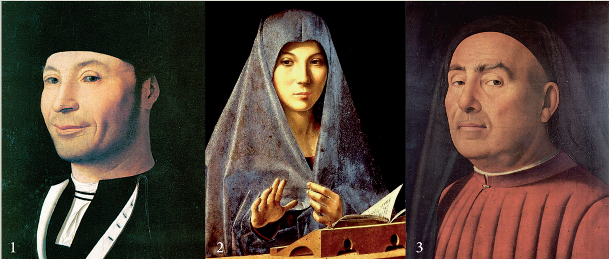
Antonello da Messina. 1) “Ritratto di ignoto marinaio” Museo Mandralisca Cefalù (PA); 2) “Annunciata” Galleria Palazzo Abatelli Palermo; 3) “Ritratto d'uomo” Museo Civico d'Arte Antica, Palazzo Madama Torino.

Antonello, attaccato alla sua Sicilia, trasporta la luce della sua terra sui volti dall'incarnato bruno e dagli occhi neri. Volti che come scrive Sciascia sono “ di chioistro e ovile ”. Volti che Antonello incontrava nella sua Messina e che noi incontriamo nelle piazze delle nostre città.