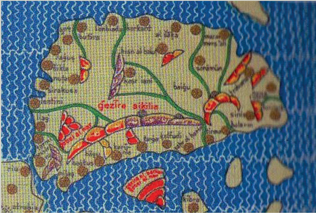
Mappa della Sicilia di Idrisi XII sec.

La carta qui riportata è tratta dall'edizione curata da K. Miller.